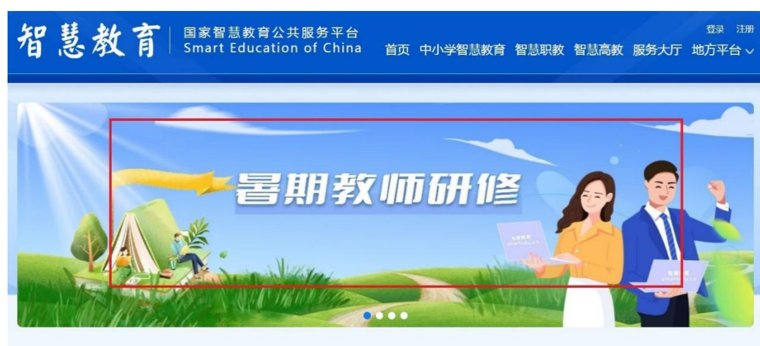
步骤1：点击“暑期教师研修”，进入暑期教师研修专题页

进入专题页后，点击右侧“基础教育学习入口”。在弹出的“国家中小学智慧教育平台”页面右上角完成注册、登录。后续步骤同方式一。