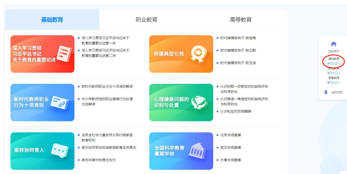
步骤2：点击暑期教师研修专题页右侧“基础教育学习入口”